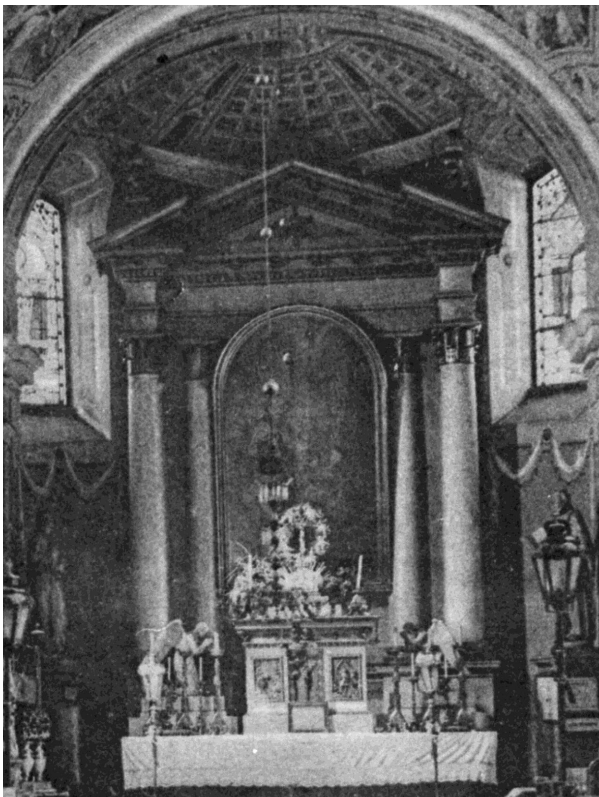
A kerényi Sárkány Boldogasszony-templom szentélye (archív felvétel, 1900 körül)